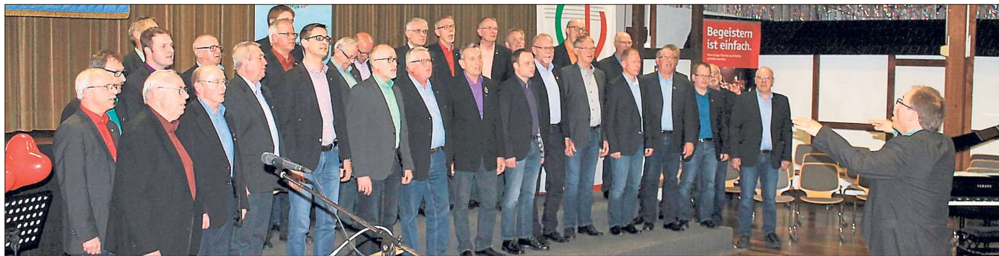
Der Männergesangsverein Herzfeld-Hovestadt war bereits zum neunten Mal der Ausrichter des Lippetal-Chorfestes und feierte damit sein 160-jähriges Bestehen. Er präsentierte sich unter der Leitung von Jörg Bückler wieder sehr kreativ.